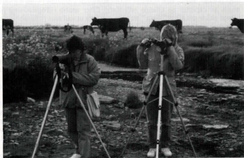
Skärfläcka i kikaren!

Vad de ornitologiska iattagelserna beträffar, kunde vi också bara konstatera, att detta med Öland, var ju verkligen något speciellt. Här var t.ex. häger, skarv, gravand en vanlig syn under våra exkursioner, och näktergal och grönsångare sjöng i varje lund och dunge. Av Ölands specialiteter såg vi bland annat ängshök och skärfläcka och också liten flugsnappare. Sammanlagt räknade vi in vid pass 86 arter, trots att i vår lista fattades t.ex. mesar o.a. barrskogsbetingade fåglar plus en del för oss hemma vanliga exkursionsarter.